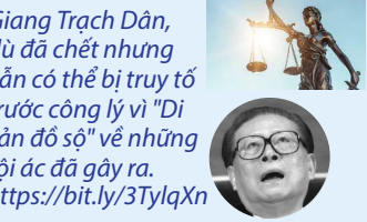
Giang Trạch Dân, dù đã chết nhưng vẫn có thể bị truy tố trước công lý vì "Di sản đồ sộ" về những tội ác đã gây ra. https://bit.ly/3TylqXn