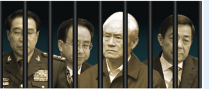
Từ trái qua: Từ Tài Hậu, Lệnh Kế Hoạch, Chu Vĩnh Khang, Bạc Hy Lai.

Những trường hợp trên (trong số hàng nghìn trường hợp) là một lời nhắc nhở từ bi đối với những kẻ hành ác. Nhiều người bức hại Pháp Luân Công chỉ đơn giản vì để “chấp hành mệnh lệnh,” song nguyên lý phổ quát “thiện ác hữu báo” vẫn yêu cầu họ phải chịu trách nhiệm về những hành động của mình. Chỉ bằng cách ngừng làm điều sai trái - ít nhất là không tham gia vào việc bức hại Pháp Luân Công (Phật Pháp), đồng thời làm việc thiện để bồi hoàn thì họ mới có thể thoát được quả báo. (Xem thêm tại vn.minghui.org )